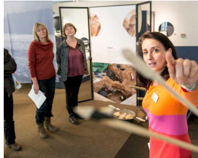
Gastgeberin Historisches Museum Olten