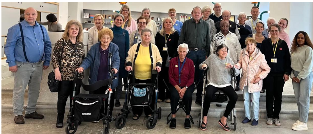
Altersresidenz mit TiMer*innen zu Besuch im Kunst Museum Winterthur