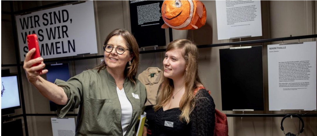
TiM heisst, im Museum gemeinsam Geschichten erfinden, sich dazu austauschen und diese online stellen.