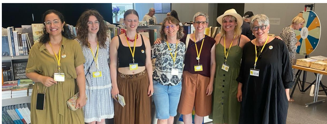
Jubiläum Chur mit TiMer*innen, die Geschichten sammeln

Am 3. Juni 2025 fand im vorarlberg museum in Bregenz die erste TiM-Bodensee-Netzwerktagung statt, zu der rund 50 Teilnehmende aus Österreich, Deutschland, der Schweiz und Liechtenstein zusammenkamen. (TiM) Vorarlberg und TiM Schweiz wurden unterstützt durch die Internationale Bodenseekonferenz (IBK). Gemeinsam setzten sie ein Zeichen für eine neue Form der grenzüberschreitenden Zusammenarbeit. Die Tagung verfolgte mehrere Ziele: den Austausch zwischen erfahrenen und neuen TiMer*innen, die Vorstellung bewährter Methoden, das Knüpfen neuer regionaler Netzwerke und die gemeinsame Entwicklung von Ideen, wie Museen künftig noch zugänglicher und partizipativer gestaltet werden können. Schon im Vorfeld zeichnete sich ein Erfolg ab: Für die deutsche Seite des Bodensees konnte erstmals eine TiM-Regio-Verantwortliche gewonnen werden – ein entscheidender Schritt für die nachhaltige Verankerung des Projekts in der gesamten Vierländerregion.