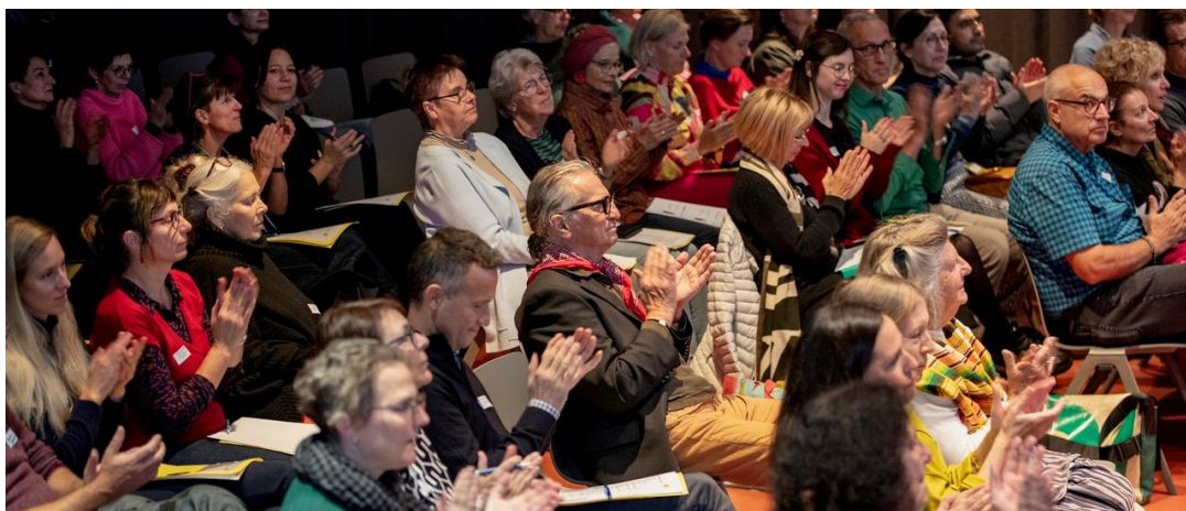
Am Impuls#13: Grosses Interesse, Austausch über TiM und die Fokusthemen