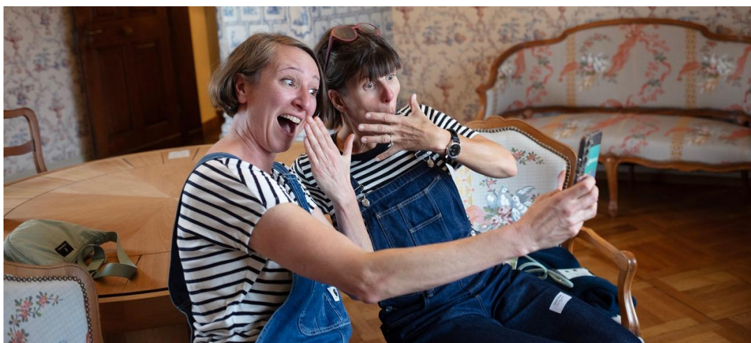
Am Impuls#13: Austausch der Regio-Verantwortlichen beim Geschichten erfinden