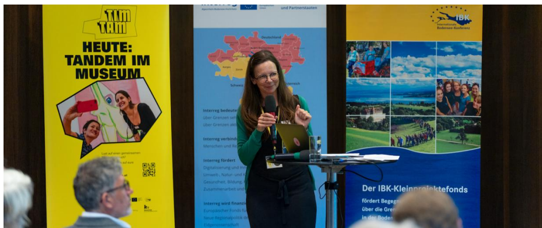
Bodenseetagung Bregenz mit Interreg (3.6.2025)