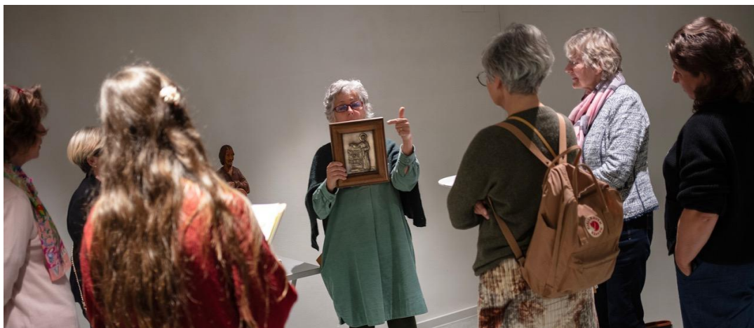
Peer Learning am Marktplatz beim Impuls#13