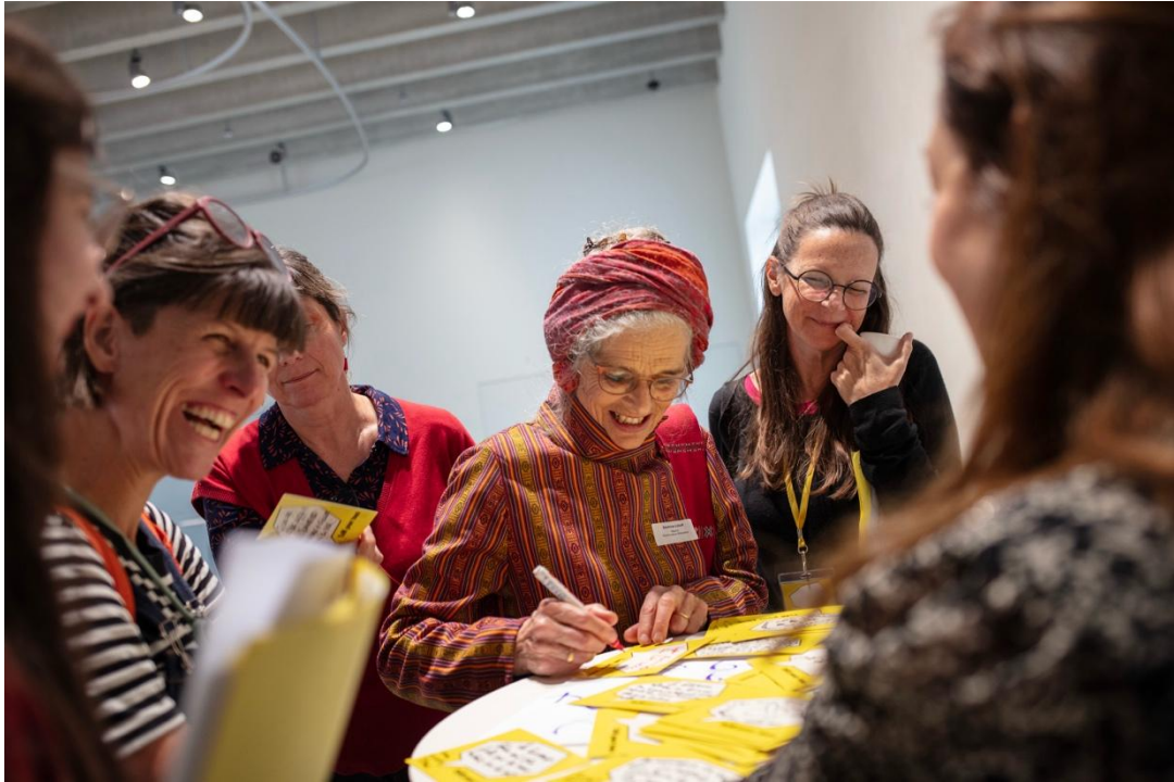
TiM Impuls#13 zum Jahresthema «Fokus 60plus» und «neu hier» in Aarau