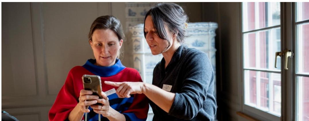
Am Impuls#13: Gemeinsam erfinden als Verbindungselement