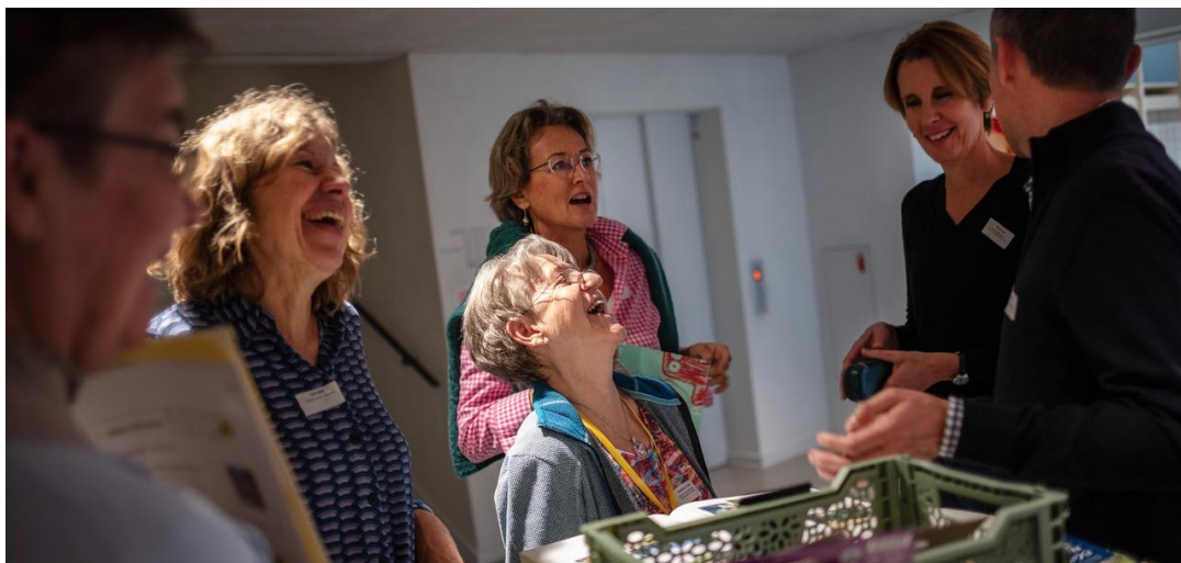
Am Impuls#13: Austausch am Marktplatz