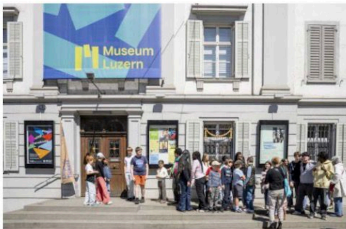
Mit Vorfreude im Gepäck: Die beiden Klassen erreichen das Museum Luzern.

Ein Austausch zwischen Altersstufen – das ist die Idee des Projekts «Zusammen ins Museum» der Schule Mariahilf. Ob Steinadler oder Fuchs: Die Lernenden erschaffen zu zweit eine Geschichte und eine Zeichnung, inspiriert von Exponaten des Museums.