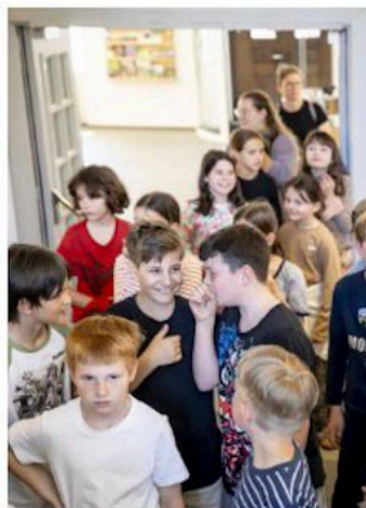
Die Spannung steigt: Wie geht man mit den Exponaten in der Ausstellung um?